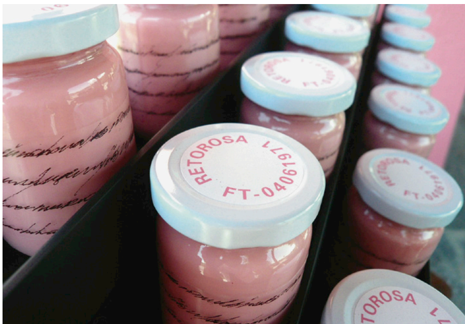
Ein besonderes Souvenir: Die Farbenherstellerin Knuchel AG verkauft die von ihr gemischte Farbe für den Attiswiler Kirchturm in kleinen Fläschchen.

dorf Wiedlisbach. Es handelt sich um eine Summe von insgesamt 30'000 Franken.