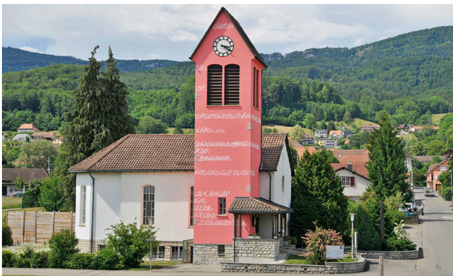
Der Kirchturm der reformierten Kirche in Attiswil trägt noch bis zum 30. Oktober 2011 ein rosa Kleid.

Seit dem 22. Mai 2011 ist der Kirchturm unverhüllt. Welche Reaktionen hat er bisher vernommen? «Überwiegend positive. Die Leute sind angenehm überrascht. Nur auf einer anonymen Karte wurden die Kosten reklamiert, dabei hat die Person übersehen, dass mein Werk von Sponsoren finanziert wird, und zwar von drei regionalen Firmen.» Diese sind das Malergeschäft Giesser (Langenthal), der Gerüstbauer Menz (Luterbach) sowie der Farbenhersteller Knuchel AG aus dem Nachbar-