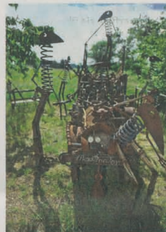
Freddy Madörins futuristische Figuren ernähren sich von Strahlen.