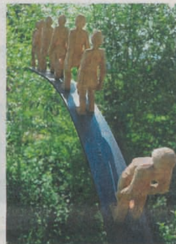
Christof Cartiers Holzfiguren gehen «vorwärts» – bis zum Abgrund.