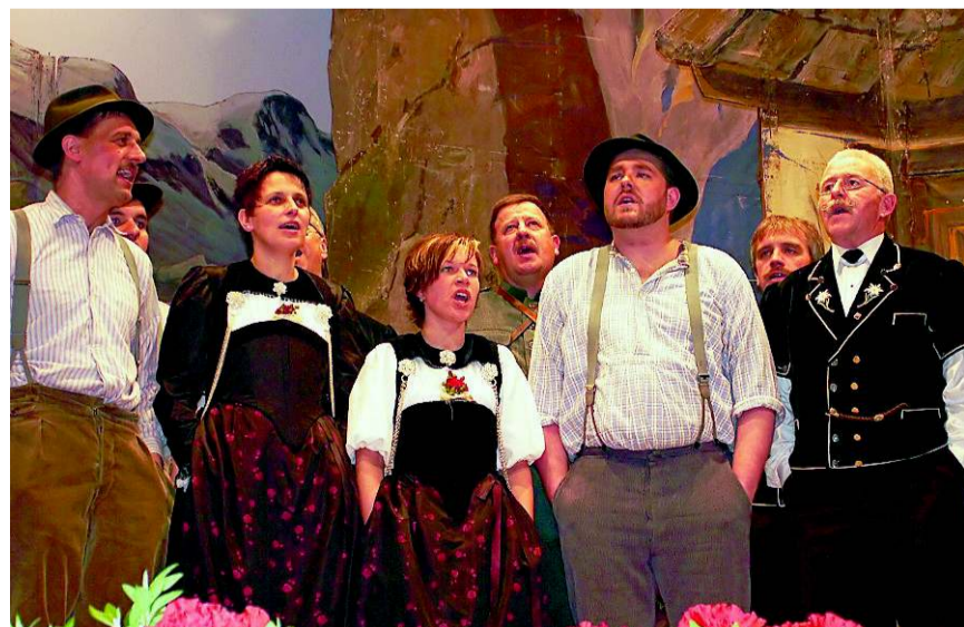
Der Jodlerklub Eriswil unterhält sein Publikum bestens.