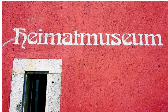
Das Museum ist auch rosarot.